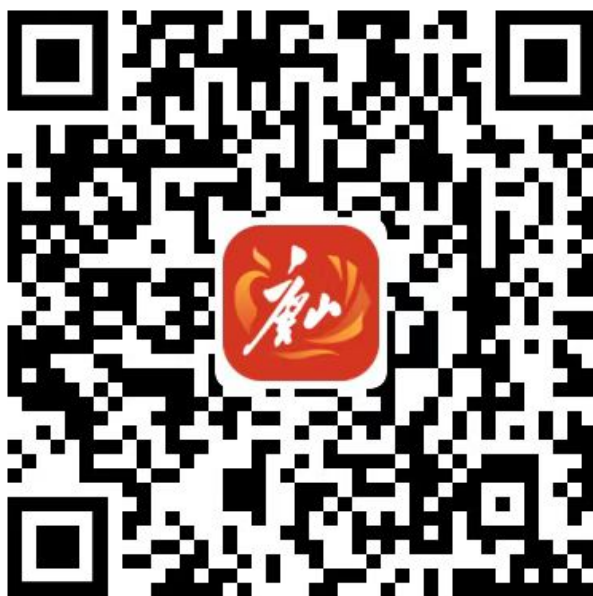
图2：幸福唐山APP下载二维码