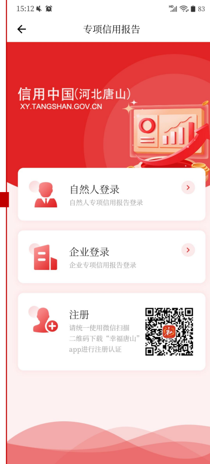
图4：自然人报告申请