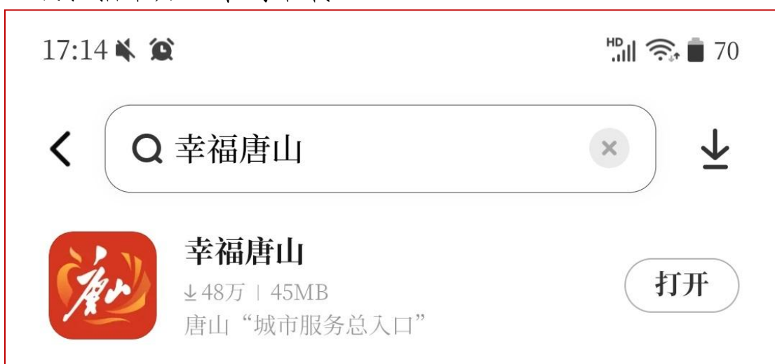
图1：应用商店下载幸福唐山APP